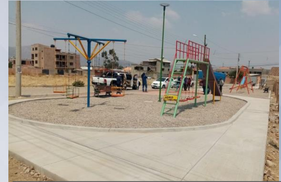
CONST. PARQUE INFANTIL OTB HUAYLLANI OESTE (PARQUE INFANTIL Y RECORRIDOS DISTRITO 4)

105 Comunidades beneficiadas, entre otb's y sindicatos agrarios