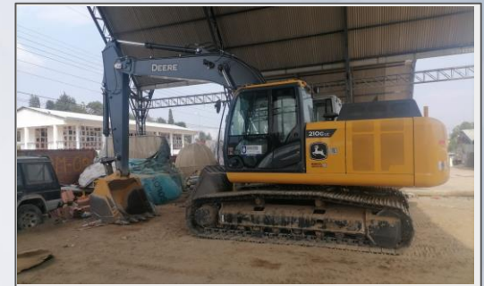
Excavadora Hidráulica para construcción de Atajados.