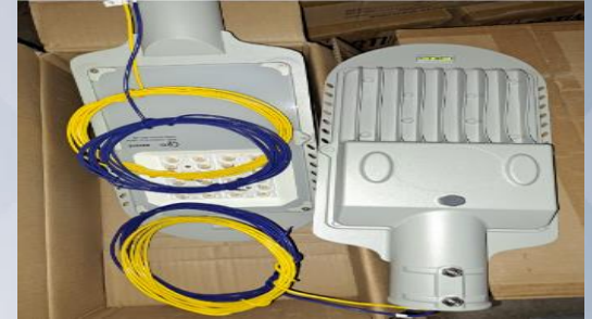
Adquisición de Luminarias

Adquisición de 611 luminarias, brazos y accesorios para el área urbano. Población beneficiada de los distritos 1, 2, 3, 4, 6 y 7.