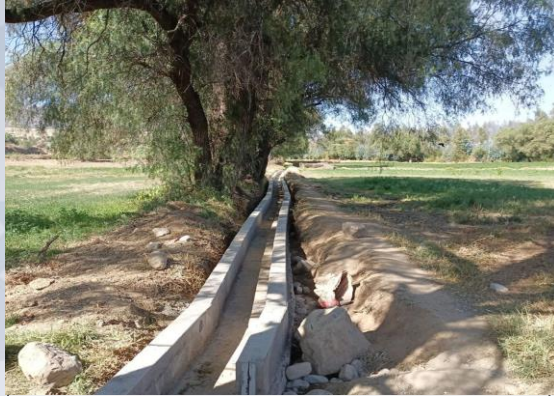
CONST. SISTEMA DE MICRO RIEGO DISTRITO 1 PQTE. 1 (CONST. CANAL TRAMO 2 Y 3 OTB CURUBAMBA BAJA 2)