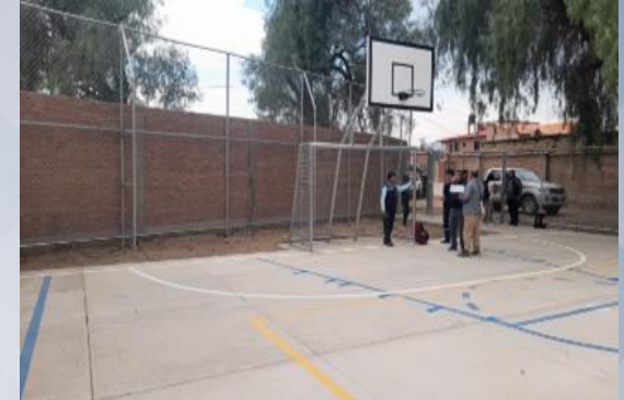
CONST. CAMPO DEPORTIVO OTB ABRA CENTRAL DISTRITO 6 (CANCHA MÚLTIPLE Y MALLA OLÍMPICA)