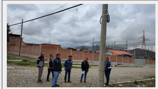
Inspección a los Postes de cámaras de seguridad ciudadana en el distrito 2