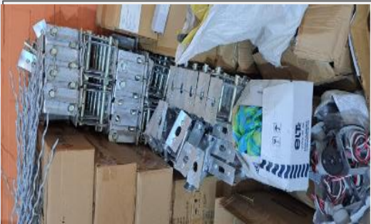
Accesorios para los Distritos