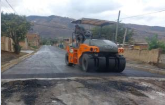
CONST. PAVIMENTO ZONA NOROESTE DISTRITO 1 ( OTB LAICACOTA CENTRAL)