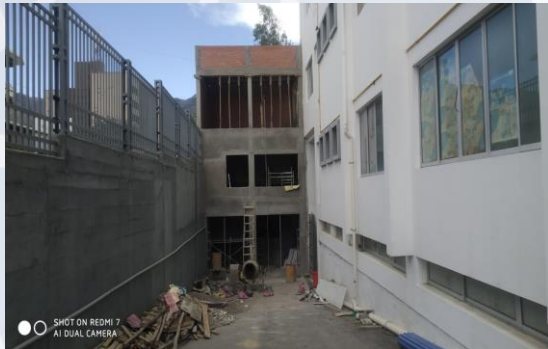
MEJ. HOSPITAL SOLOMON KLEIN DE SEGUNDO NIVEL DISTRITO 2 (OBRAS COMPLEMENTARIAS SEMISÓTANO, IMPLEMENTACIÓN DE UNIDAD DE CIRUGÍA BUCAL Y AMPLIACIÓN DE COMEDOR)