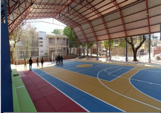
MEJ. CAMPOS DEPORTIVOS DISTRITO 3 (OTB ESCALERANI - ENMALLADO, PAVIC, REFLECTORES Y PINTURA PARA EL CAMPO DEPORTIVO)