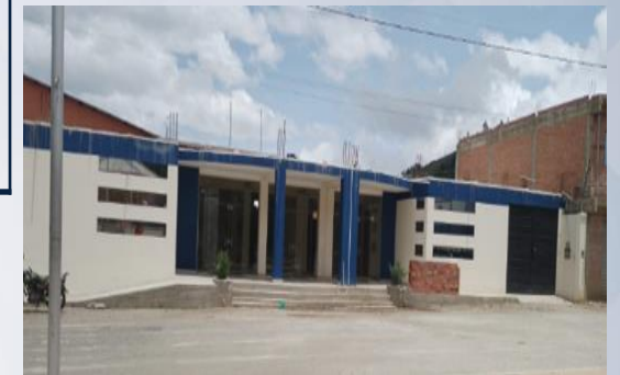
CONST. BIBLIOTECA CENTRAL AGUIRRE 1 (OBRA GRUESA Y FINA PLANTA BAJA)