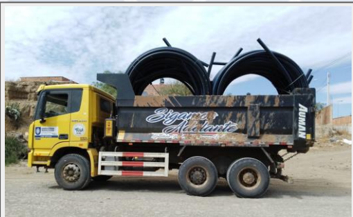
Volqueta para el Distrito Rural Palca