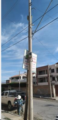
Postes de cámaras de seguridad ciudadana distrito 2