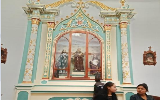
RESTAU. PATRIMONIO CULTURAL IGLESIA SAN PEDRO DE SACABA (RESTAU. CUBIERTA NAVE SUDOESTE, ALTARES NAVES CENTRAL Y ALTAR BAUTISTERIO)