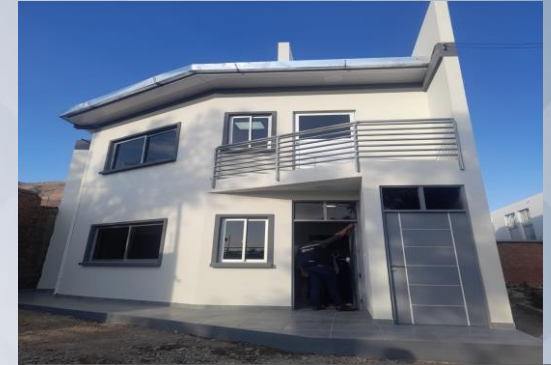
CONST. CONSULTORIO VECINAL OTB. CHILLIJCHI (OBRA FINA)