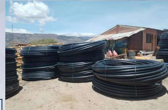
CONST. SANEAMIENTO BÁSICO TUTIMAYU (ADQUISICION DE TUBERIAS CESAR LOMA Y CRUZ LOMA)

14 proyectos de inversión en el sector Saneamiento Básico 17 Comunidades beneficiadas, entre otb's y sindicatos agrarios.