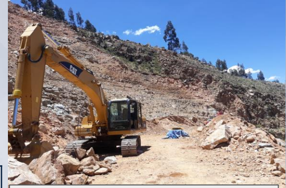
MANTENIMIENTO Y MEJORAMIENTO DE CAMINO FIERO MAYU SUBCENTRAL UCUCHI

6 proyectos de inversión en el sector Transportes. Beneficiarios otb's y sindicatos agrarios