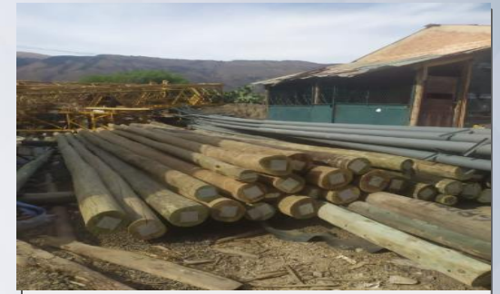
Postes de Alumbrado Público.