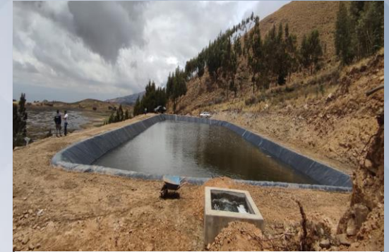
CONST. SISTEMA MICRO RIEGO LARATY CHICO DISTRITO 5

38 proyectos de inversión en el sector Agropecuario.