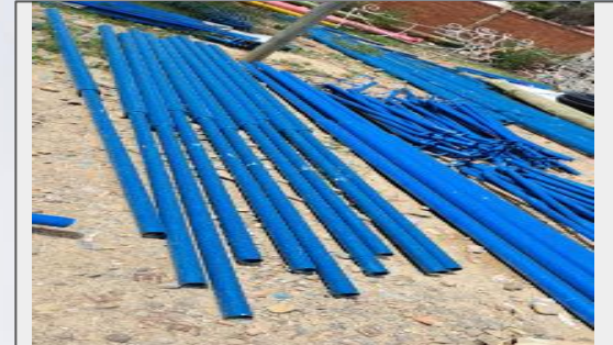
Adquisición de postes para farolas