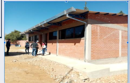
MEJ. UNIDAD EDUCATIVA DIONISIO SOLÍS LOPEZ DISTRITO LAVA LAVA (CONSTRUCCIÓN DE 2 AULAS)