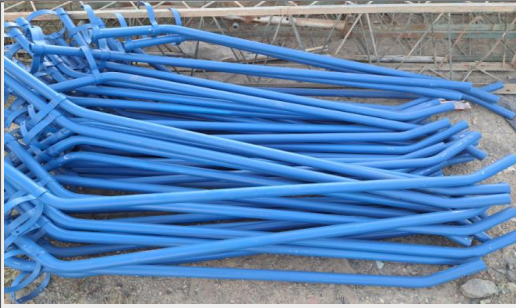
Brazos de luminarias