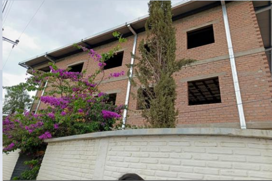
CONST. ÁREA DE EMERGENCIA HOSPITAL MÉXICO DISTRITO 1 (OBRA GRUESA MUROS EXTERIORES 1º Y 2º PISO)

4 proyectos de inversión en el sector Salud