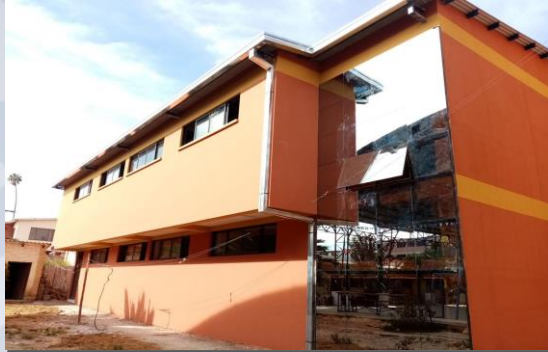
CONST. COLISEO U.E. JOSÉ LEONCIO CAPRILES DISTRITO 1 (OBRA FINA)