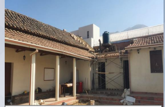
REFACCION PATRIMONIOS CULTURALES (IGLESIA VIRGEN INMACULADA CONCEPCIÓN)

3 proyectos de inversión en el sector Cultura