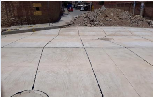
MANTENIMIENTO Y MEJORAMIENTO DE VÍAS URBANAS. DISTRITO 1