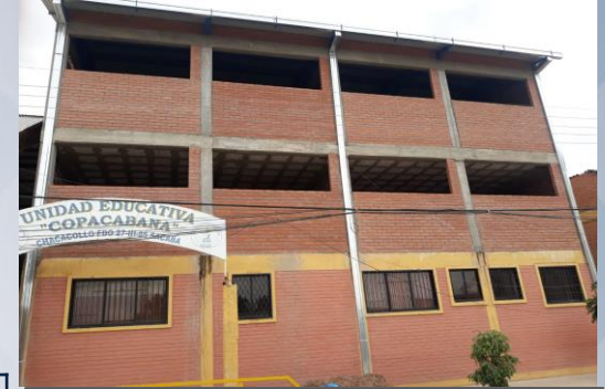
CONST. BLOQUE ADMINISTRATIVO Y AULAS U.E. COPACABANA DISTRITO 2 (OBRA GRUESA)

45 proyectos de inversión en el sector Educación Beneficiarios : 38 Unidades Educativas