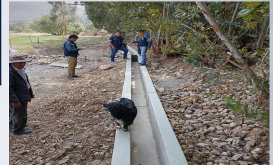
CONST. SISTEMAS DE MICRO RIEGO CURUBAMBA CENTRO Y ALTO DISTRITO 7 (CURUBAMBA ALTA)