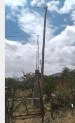
Inst. de red de Alumbrado público

En Proyectos se realizó la instalación de 85 luminarias, brazos y accesorios y 2920 m de red de alumbrado público, en los distritos 2, 4. y Ampliación de red de media y baja tensión para bombeo de pozo. Población beneficiada distrito 2, 4 y Chiñata.