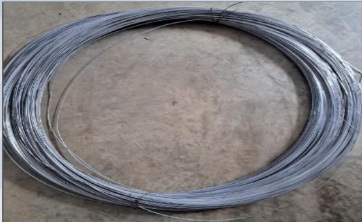
Alambre galvanizado para el amarre de brazos de las pantallas