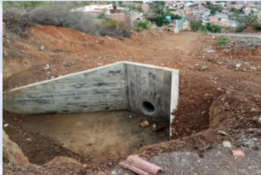
CONST. DESAGÜE PLUVIAL OTB LA VERTIENTE DISTRITO 3