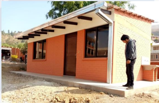
MEJ. UNIDAD EDUCATIVA PACATA DISTRITO 3 (MURO DE CONTENCIÓN Y PORTERÍA)