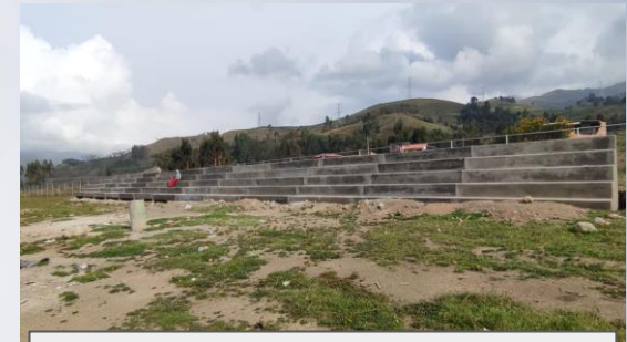
CONST. CAMPO DEPORTIVO AGUIRRE 2 (GRADERIA LADO NORTE)