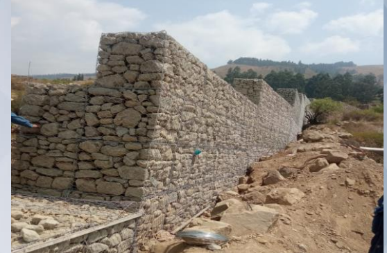
CONST. GAVIONES PARA TORRENTERA WARA WARA DISTRITO 3

3 otb's beneficiadas y 1 todo el municipio de Sacaba.