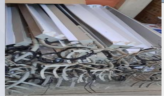
Pantallas para tubos led