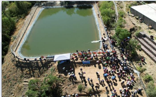
CONST. SISTEMA DE MICRORIEGO AULL (ATAJADO Y ENMALLADO)