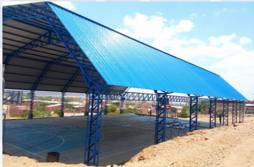
CONST. CAMPO DEPORTIVO OTB. ALTO PARAISO DISTRITO 7 (TINGLADO)