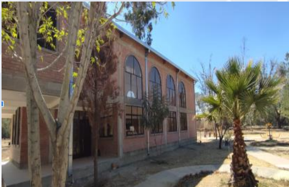
CONST. CENTRO MULTIFUNCIONAL PRODUCTIVO OTB. CHACACOLLO LOS PINOS (OBRA FINA)