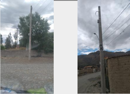
Postes de cámaras de seguridad ciudadana distrito 4

Se realizó la instalación de 38 postes para cámaras de seguridad ciudadana en los distritos 2, 3 y 4, Población beneficiada del área urbana.