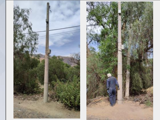
Postes de cámaras de seguridad ciudadana distrito 3