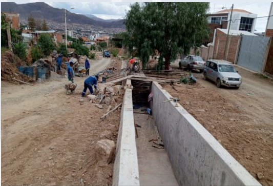
CONST. CANALIZACIÓN TORRENTERA CHICAMAYU DISTRITO 2 (OTB PUNTITI CHICO NORTE Y OTB MARAVILLAS)