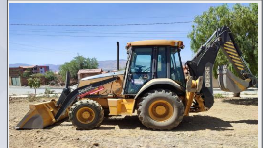
Retroexcavadora para el Distrito Lava Lava

Adquisición de 5 maquinarias pesadas y semipesadas (3 Retroexcavadoras, 1 Excavadora Hidráulica y 1 Volqueta). Población distrito Urbano 4, distrito rural Lava lava distrito rural Palca beneficiarios con la maquinaria pesada y semipesada para atención a diferentes solicitudes de emergencia. Además toda la población sacabeña con la adquisición de excavadora hidráulica, y retroexcavadora destinados a construcción de atajados para captación de agua para la producción agrícola, piscícola, etc.