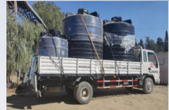
AMPL. SISTEMA DE AGUA POTABLE QUEWIÑAL DISTRITO PALCA (ADQ. DE INSUMOS; LOTE 1 ADQUISICIÓN DE TUBERÍAS HDPE Y ACCESORIOS; LOTE 2 ADQUISICIÓN DE TANQUES DE AGUA Y ACCESORIOS)