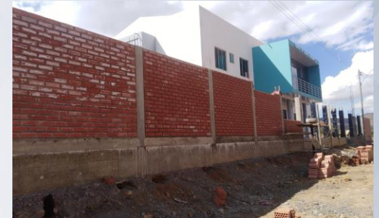
CONST CENTRO DE SALUD KORIHUMA (MURO PERIMETRAL)