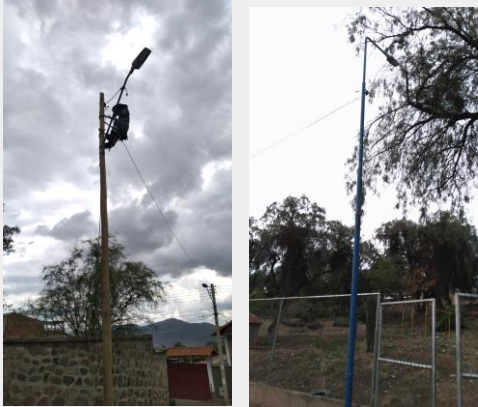
Inst. de luminarias y postes de alumbrado público