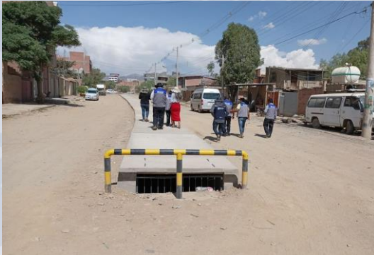
AMPL. DESAGÜE PLUVIAL AV. CIRCUNVALACIÓN SUD DISTRITO 1