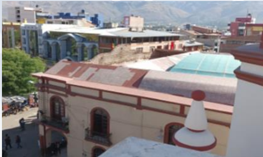
REFACCIÓN PATRIMONIOS CULTURALES (MUSEO CONSISTORIAL)