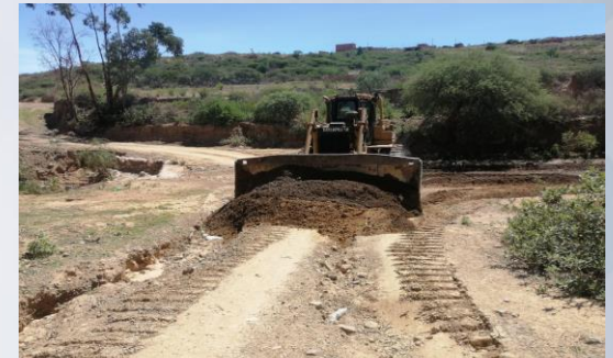
MANTENIMIENTO Y MEJORAMIENTO DE CAMINO DE VIAS DISTRITO LAVA LAVA