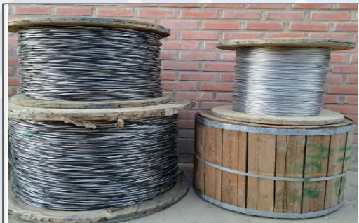
Duplex e Hilo Piloto para ampliación de Alumbrado Público

Adquisición de 194 luminarias, brazos y accesorios para el área rural Población beneficiada de los distritos Lava Lava, Chiñata y Ucuchi.