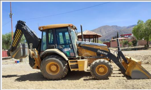
Retroexcavadora para el Distrito 4