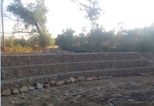
CONST. GAVIONES PARA TORRENTERA OTB LINDE BAJO DISTRITO 1